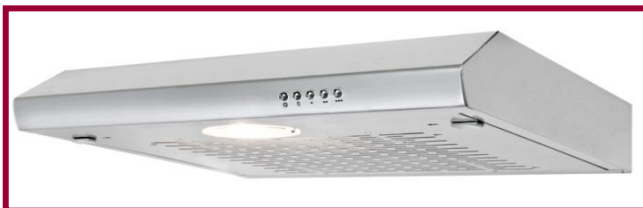
UBH 08 Inoxlook