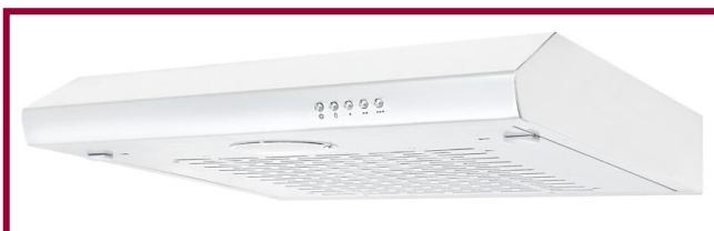
UBH 08 Weiß