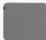
HP 100 desinfecteerbare muispad 8X594AA