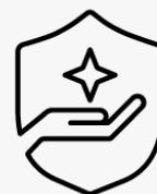
3 jaar haal- en brengservice UIPS3E