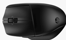
HP 480 Comfort Bluetooth-muis 8T6M3AA